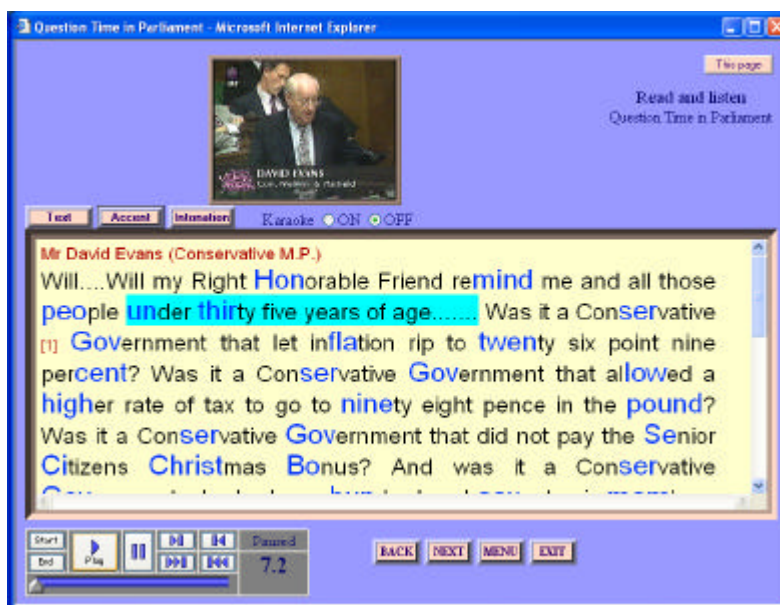
Figure 2. Interface générée par SWANS

Le Logiciel SWANS génère une suite de pages Web qui assurent les fonctionnalités suivantes :